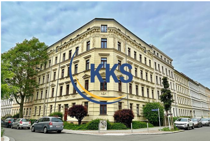
Hausansicht 2025 1.