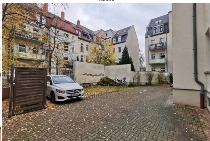
Hof mit Stellplatz