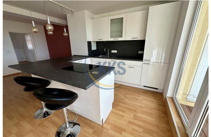
Küche - Einrichtungsbeispiel