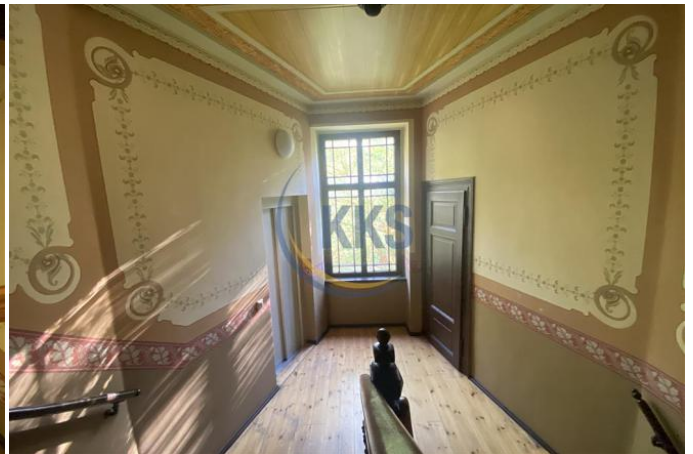
Treppenhaus mit Aufzug