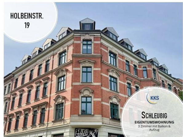
Holbeinstr. 19, WE 01, EG links mitte