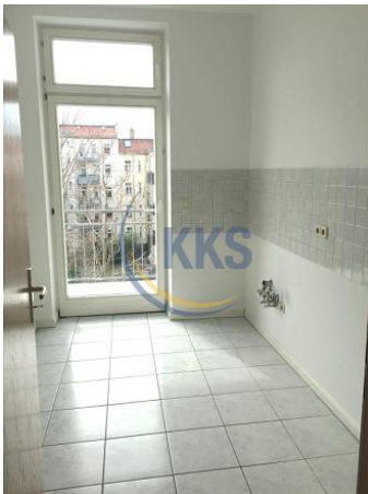
Küche mit Zugang Balkon