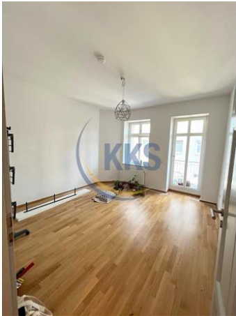
Schlafen - Referenzbild