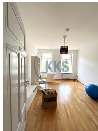
Wohnen - Referenzbild